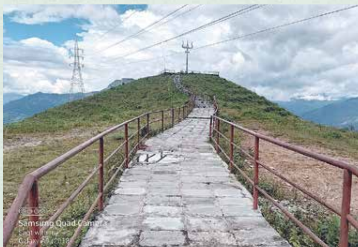
खागल डाँडा, तौथली