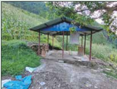
कुडलु डुहरुन तथरु डुरस नरुडरण