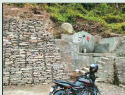
धारापानी दुङ्गेधारा निर्माण