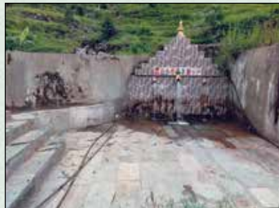
सरुदु डुङुधरु नरुडरण