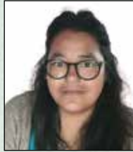
भृष्पमायाँ श्रेष्ठ प्रशासन तथा लेखा सहायक