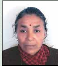
शुप्री कामी कार्यपालिका सदस्य