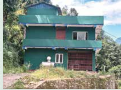
धुसुकुन सहरुकरु डवन