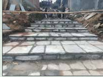
भिमसेन मन्दिर देखि त्रिपुरासुन्दरी मन्दिरसम्म सिंढी निर्माण