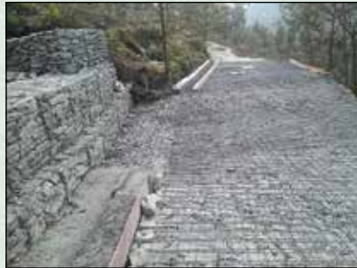
दावी सडकमा ढलान गर्न रड बिछ्याउने कार्य