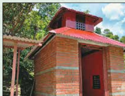
दावी सातकन्या मन्दिर