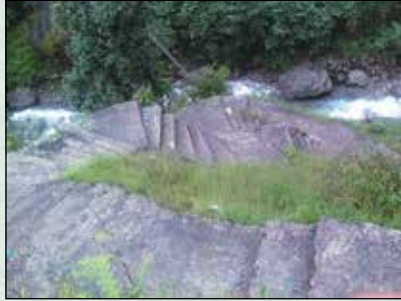
शैलनदी सिंढी बाटो