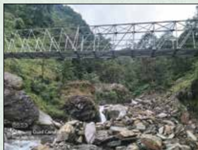
सुन्दल खोलामा निर्माण गरिएको स्टील ट्रस पुल