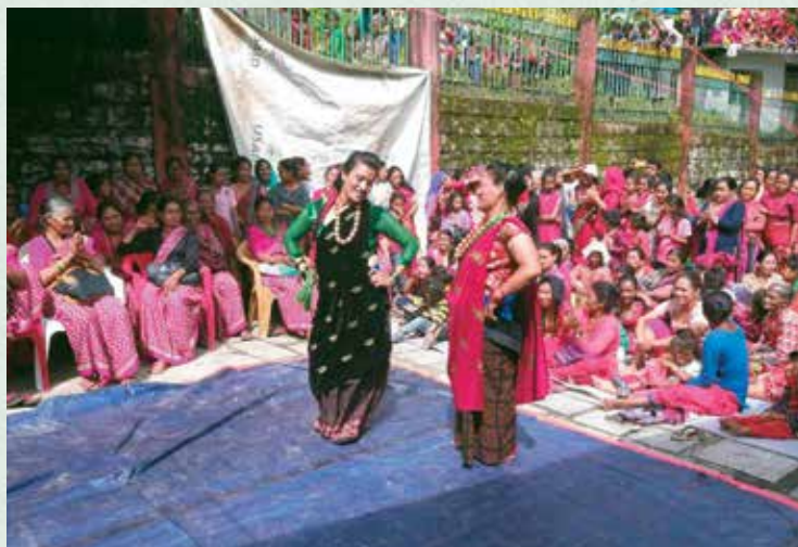
तीज विशेष कार्यक्रममा नृत्य प्रस्तुत गर्दै