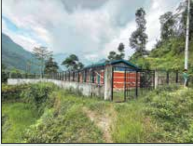
लालीगुराँस आ.वि. घेरबार