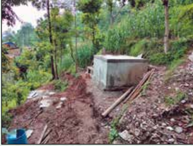
बुकेनी RCC पानी ट्याङ्की निर्माण