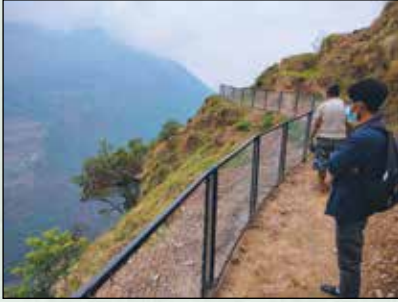
बारूलो ढोकोपोको घेराबार निर्माण