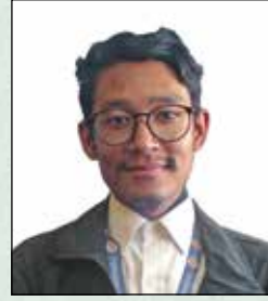
सुशलनुत शुरेशुठ इनुऑनलर