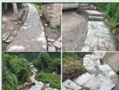
महभीर सिंठी बाटो निर्माण