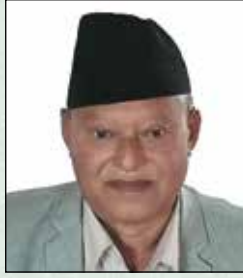
विष्णु भक्त श्रेष्ठ कार्यपालिका सदस्य