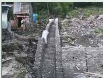
शहिद पार्कमा निर्माण गरिएको नाला