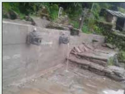
ढोकती ढुङ्गेधारा निर्माण