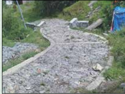
पात्ले चिहानडाँडा सडक