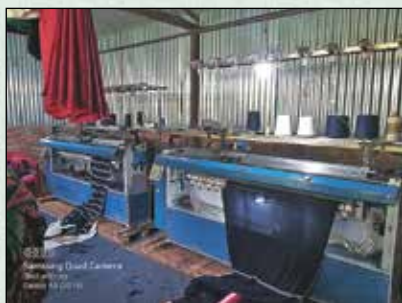
लाटु होजियारी तथा सिलाई उद्योग