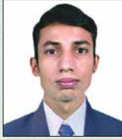
रेशड डडलुसे सव इन्जिनडर