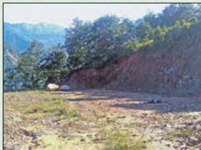
चोकटी खेल मैदान