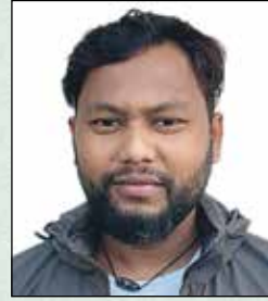
अडनुत रलऑ डुरलरलर सुवलसुथुड सह संडुऑक