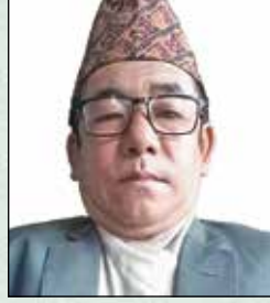
भोटोलो थामी वडाध्यक्ष