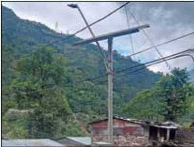
सुनकोशी बजारमा सोलार बत्ती जडान