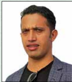
इश्वर प्रसाद पौडेल योजना तथा प्रशासन अधिकृत