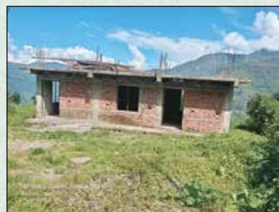
निर्माणाधिन बुङ्गाथली सामुदायिक भवन