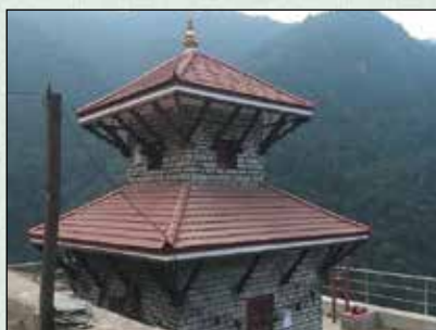
महादेव मन्दिर निर्माण