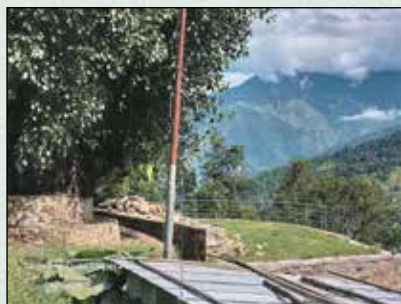
बेते पिपल बोट पार्क