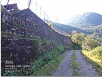
राम मा.वि. पहिरो रोकथाम