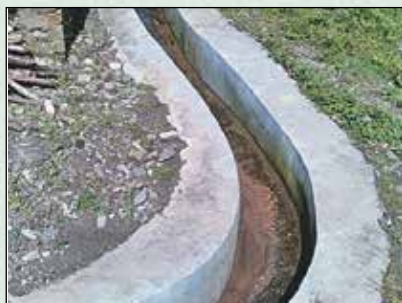
लुङ्गुर्पा टोलमा नाली निर्माण