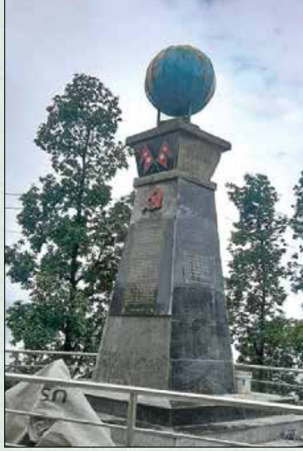
शहीद स्तम्भ, पिस्कर