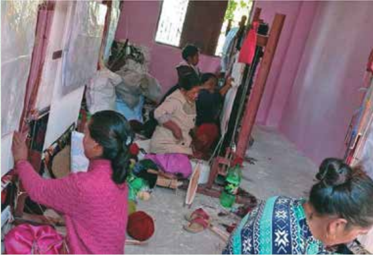
गाउँपालिकाद्वारा संचालित गलैचा बनाई तालिम