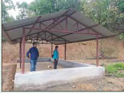
पाण्डुथान वनभोज स्थलमा ट्रेस निर्माण