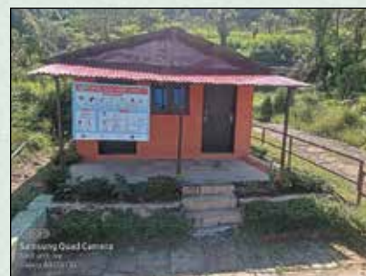
बुङ्गाथली खोप केन्द्र