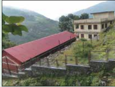
सेतीदेवी आ.वि. घेराबार निर्माण