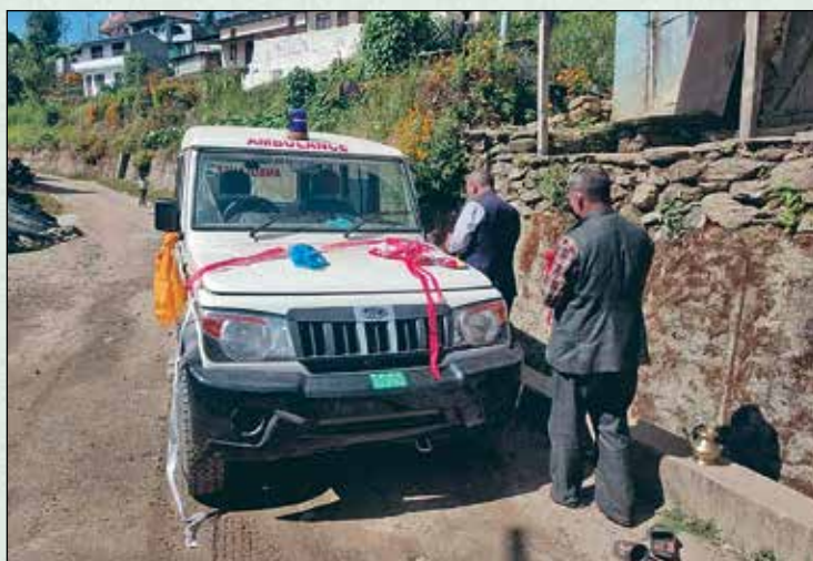
एम्बुलेन्स सेवा प्रारम्भ