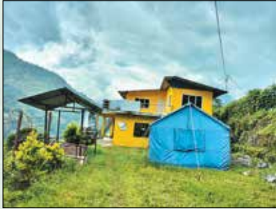
धुसुकुन सुवरुसुथु डुकु डवन