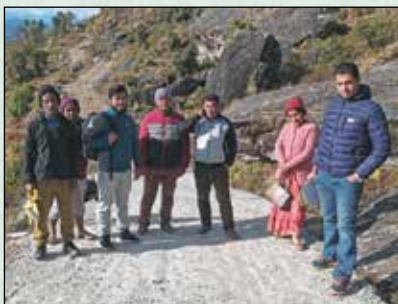
बैती पोखरे सडक