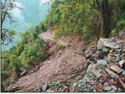
लाटु कुरी सडक