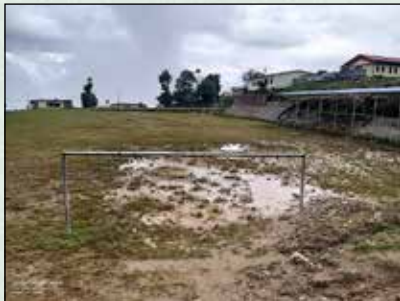
जप्सीले खेल मैदान