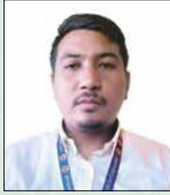
सुनलल शुरेशुठ इनुऑनलर