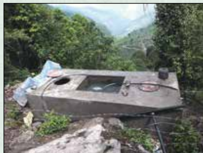
च्याँखोलामा निर्माण गरिएको सेडीमेन्ट ट्याङ्की