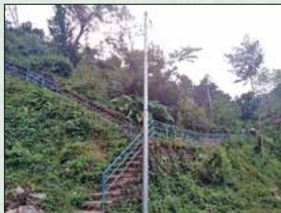
दावी सातकन्या मन्दिर जाने सिंढी बाटो रेलीड