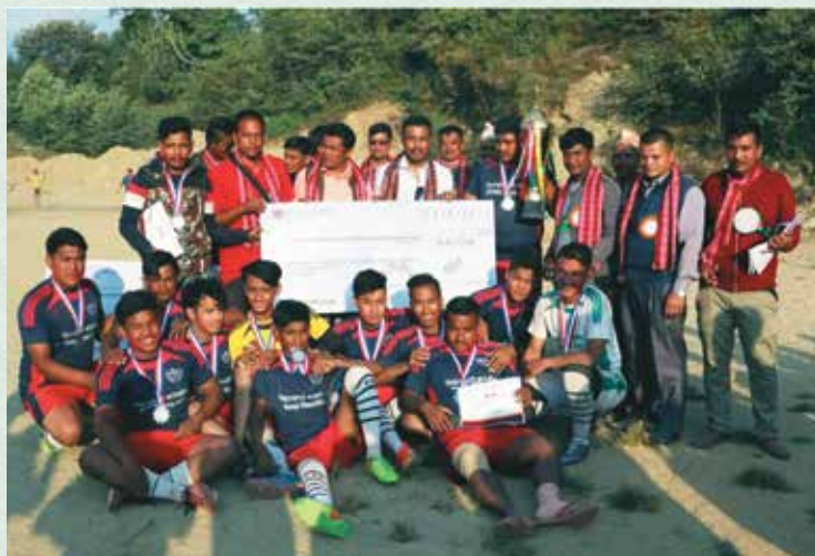
प्रथम अध्यक्ष कप फुटबल प्रतियोगिताको उप-बिजेता टिम