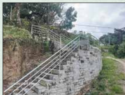
नातेश्वर मन्दिरमा सिंढी, रेलिड तथा कम्पाउड निर्माण