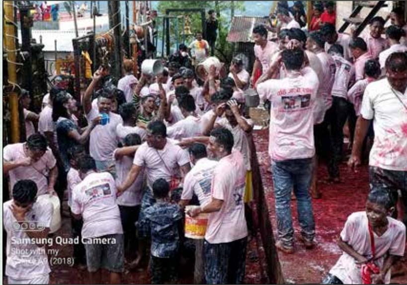
तौथलीमा मनाइने ऐतिहासिक दहि जात्रा