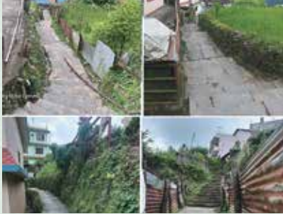
ओखरबोट राछोवा दाक्छुँ सिंढी बाटो निर्माण