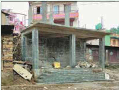
निर्माणधिन गणेशथान मन्दिर र पाटी