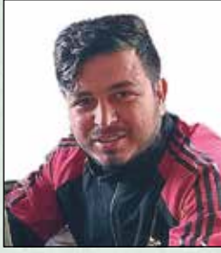
दुडडक डकगॉई सव इन्जिनडर