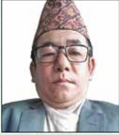
भोटलो थामी कार्यपालिका सदस्य