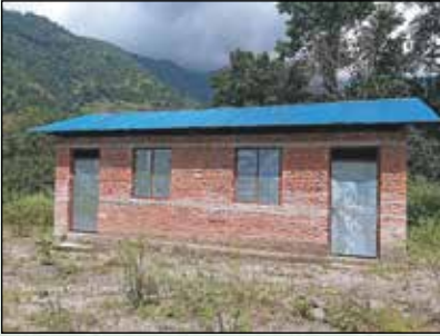
तर्केनी तरकारी संकलन केन्द्र