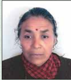
थुप्री कामी वडा सदस्य