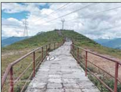
खागल डाँडा सिन्ढी बाटो