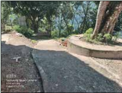
साउनेपानी देखि सिपाली टोल जाने बाटो