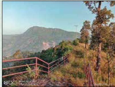
बेते बाट कालिका मन्दिर जाने बाटोमा रेलिङ निर्माण