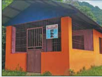
पाङ्ग्रेबोट सामुदायिक भवन