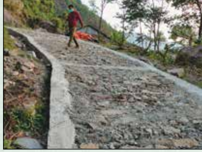
महेन्द्रप्रताप देउपुजे सडक