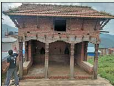
नारायण पाटी तौथली