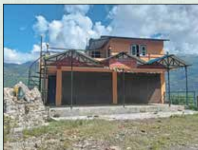
लुङ्गुर्पा सामुदायिक भवन