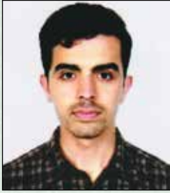
डलधव अदलकलरु सूकनुनल डुरवलधल अदलकृत