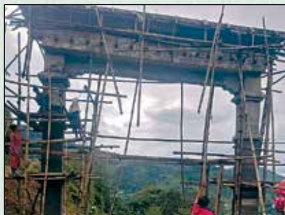
निर्माणाधिन पिस्कर शहिद गेट