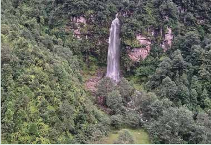
महभिर भरना, पिस्कर