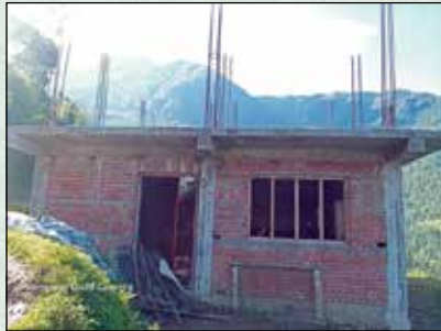
निर्माणाधिन वडा कार्यालय