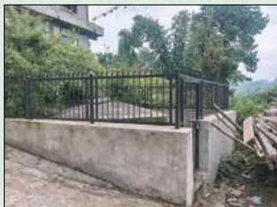
डबली RVT र घेराबार निर्माण