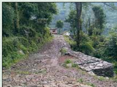
मैदान टोल सिंढी बाटो