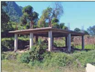
बुङ्गाथली क्लव भवन