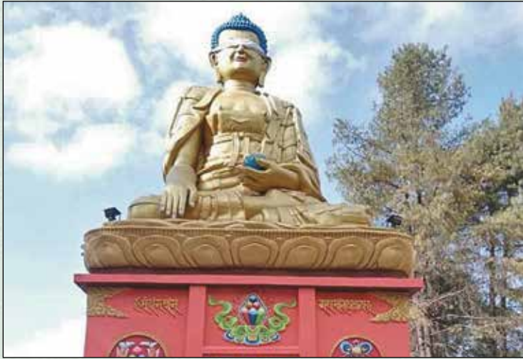
खाजीलुङ्ग बुद्धपार्क, धुस्कुन