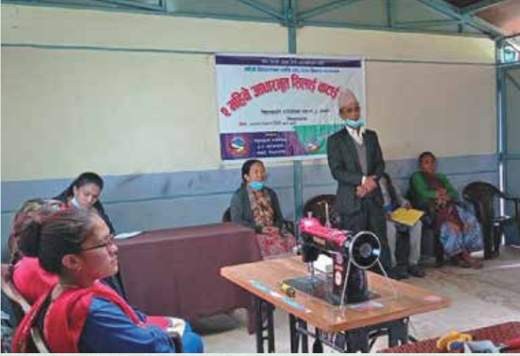
गाउँपालिकाद्वारा संचालित २ महिने आधारभुत सिलाई कटाई तालिम