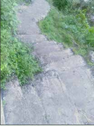
साङ्गमी टोल सिंढी बाटो