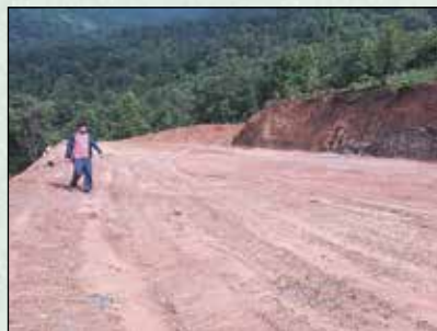
बुङ्गाथली खेल मैदान