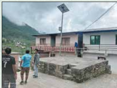
डबली निर्माण र सोलार बत्ती जडान