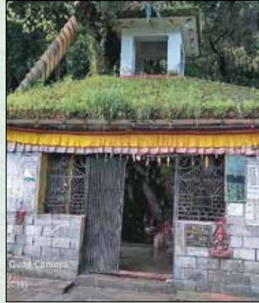
लाटु मन्दिर, चोकटी