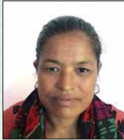
पेली थामी वडा सदस्य