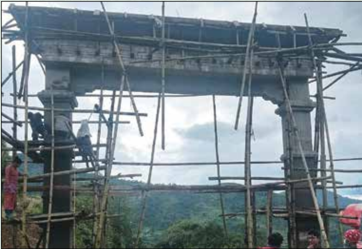
शहीद गेट, पिस्कर