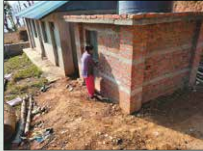
डरुतुरुथलु सरुडुदरुडक डवन