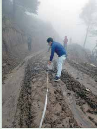
घोर्थलीबाट कालिन्चोक जाने सडक