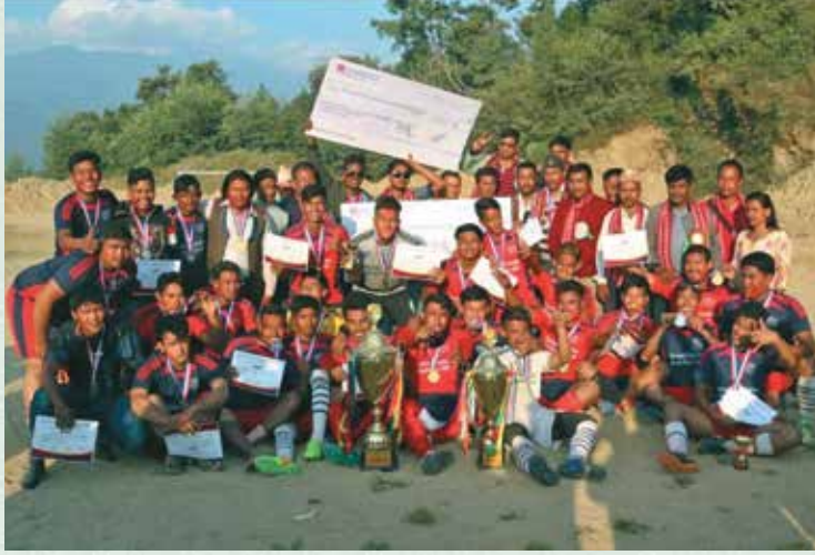
प्रथम अध्यक्ष कप फुटबल प्रतियोगिताका बिजेता तथा उप-बिजेता खेलाडीहरू