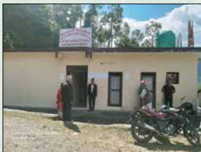
वडा कार्यालय निर्माण