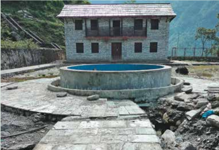
थामी संग्राहलय, पिस्कर