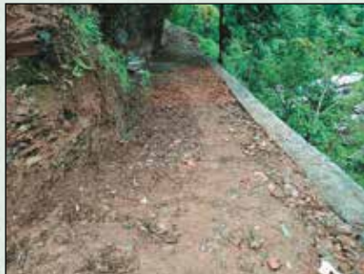
मङ्गलामाई मा.वि. जाने अपाङ्गमैत्री बाटो निर्माण