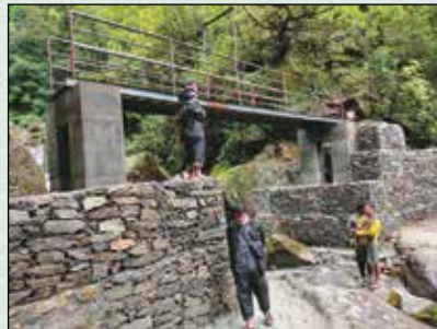
मुलाबारी पुल निर्माण