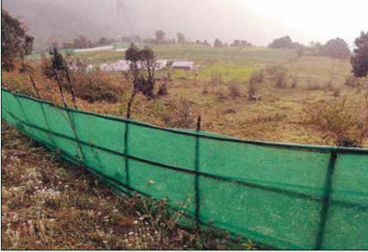
डुमथली कृषि फर्म, पिस्कर