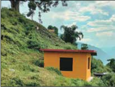
ओखले क्रियापुत्री घर