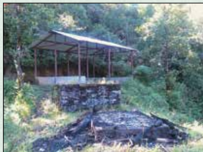
चिहान डांडामा ट्रस निर्माण