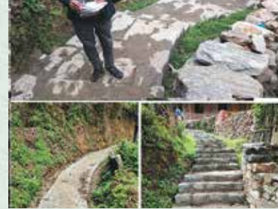
छैटुङ्गटोल सिंढी बाटो निर्माण