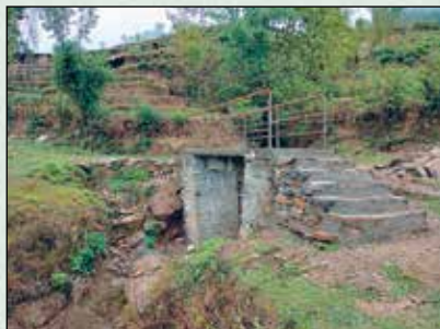
छ्वासैवाँ जोर पुलेसा निर्माण