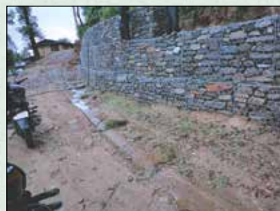
दुधकन सडकमा ग्याबिन जाली निर्माण