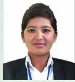
डडन कुडडरुडु शुरेशुथ डुड आई एस अडुरेडर