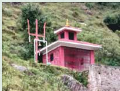
गोदावरी फूल फुल्ने मन्दिर निर्माण