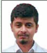
कुशल अधिकारी वैद्य