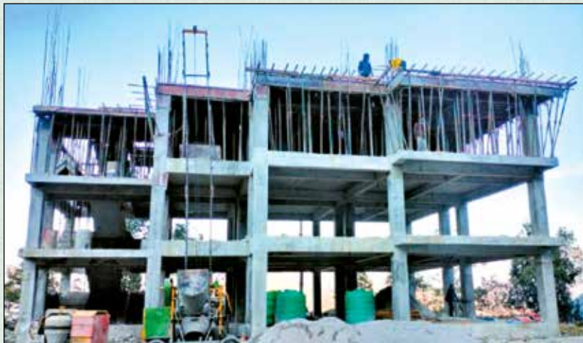
गाउँपालिकाको निर्माणाधिन प्रशासकिय भवन