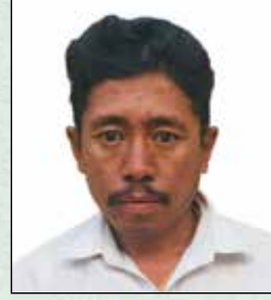
मानविर थामी कार्यालय सहयोगी