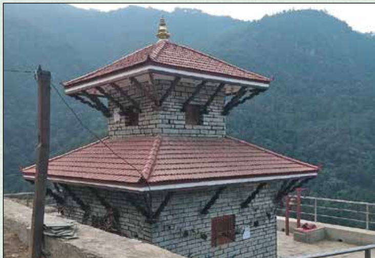
पिस्कर हत्याकाण्ड स्थलमा निर्माण भएको महादेव मन्दिर