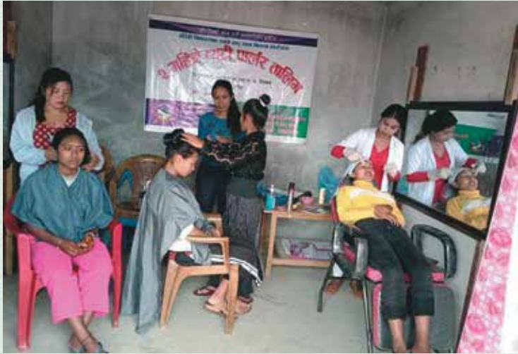
गाउँपालिकाद्वारा संचालित ३ महिने ब्युटी पार्लर तालिम