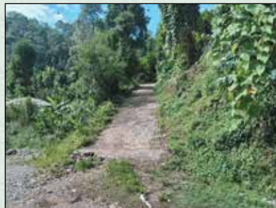
बेते कालिका मन्दिर जाने ढलान बाटो