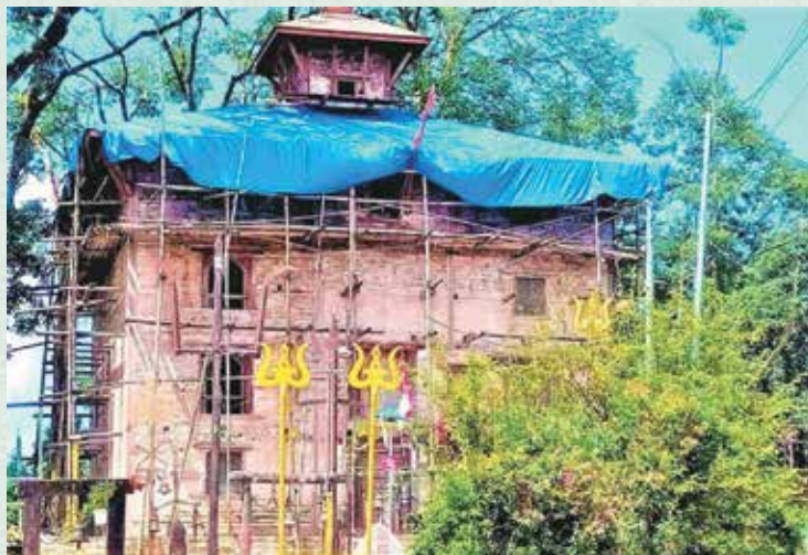
त्रिपुरासुन्दरी माईको मन्दिर, तौथली

केही महत्वपूर्ण ऐतिहासिक, धार्मिक, सांस्कृति, पर्यटकीय एवं विकासात्मक कार्यका तस्वीर