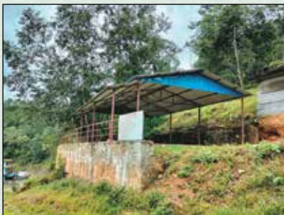
आहलडाँडा सामुदायिक भवन