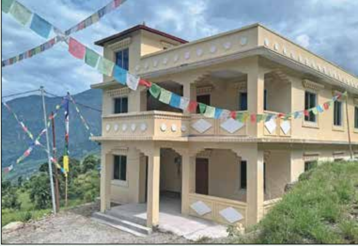
पातले गुम्बा, धुस्कुन